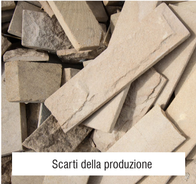
Scarti della produzione

Tutti i rifiuti generati presso INALCO sono trattati da gestori autorizzati. Il 95% dei rifiuti generati nel processo produttivo è destinato al riciclaggio per produrre altri prodotti e materie prime. Partendo dalla natura come fonte di ispirazione, Inalco seleziona i minerali migliori e accelera, grazie all'innovativo processo produttivo, il naturale ciclo litogenetico, creando un prodotto sostenibile che non distrugge l'ambiente per trovare il design perfetto, ma semplicemente lo crea. Questo processo, unico al mondo, permette di disegnare non solo la superficie, ma anche il suo interno, ottenendo un prodotto di altissimo valore aggiunto.